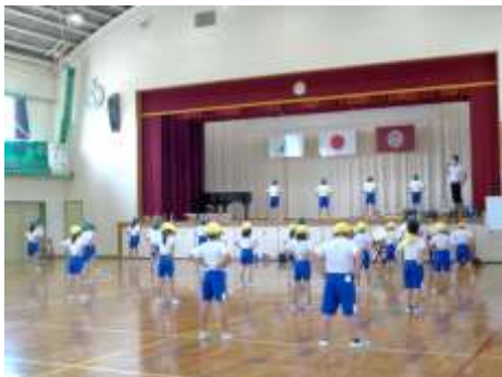
○運動会練習（中学年）