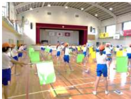
○運動会練習（高学年）