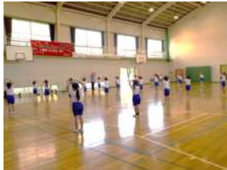
○運動会練習（低学年）