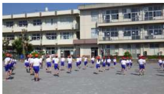
○チャレンジタイム はつらつ体操