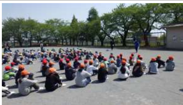
○避難訓練 全体指導