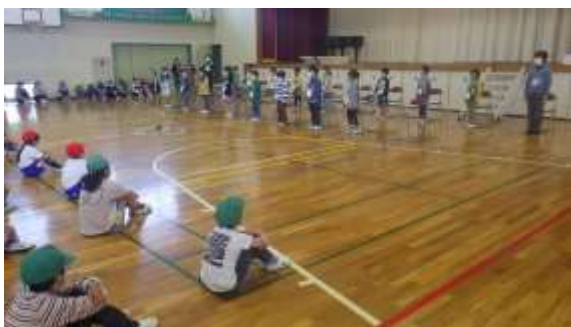
○児童集会 はじめましての会