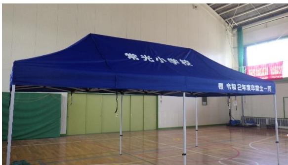
令和2年度卒業記念品