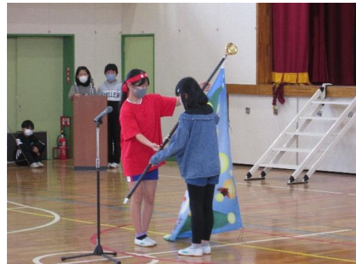
6年生を送る会「6年生発表」「児童会旗の引き継ぎ」