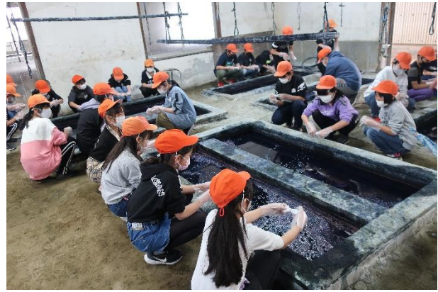
5年・社会科見学体験学習「せんべい焼き体験」「あい染め体験」